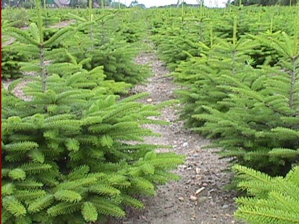
Abies NORDMANNIANA Abete del Caucaso ( Pontica = N-Turchia, W- Caucaso )