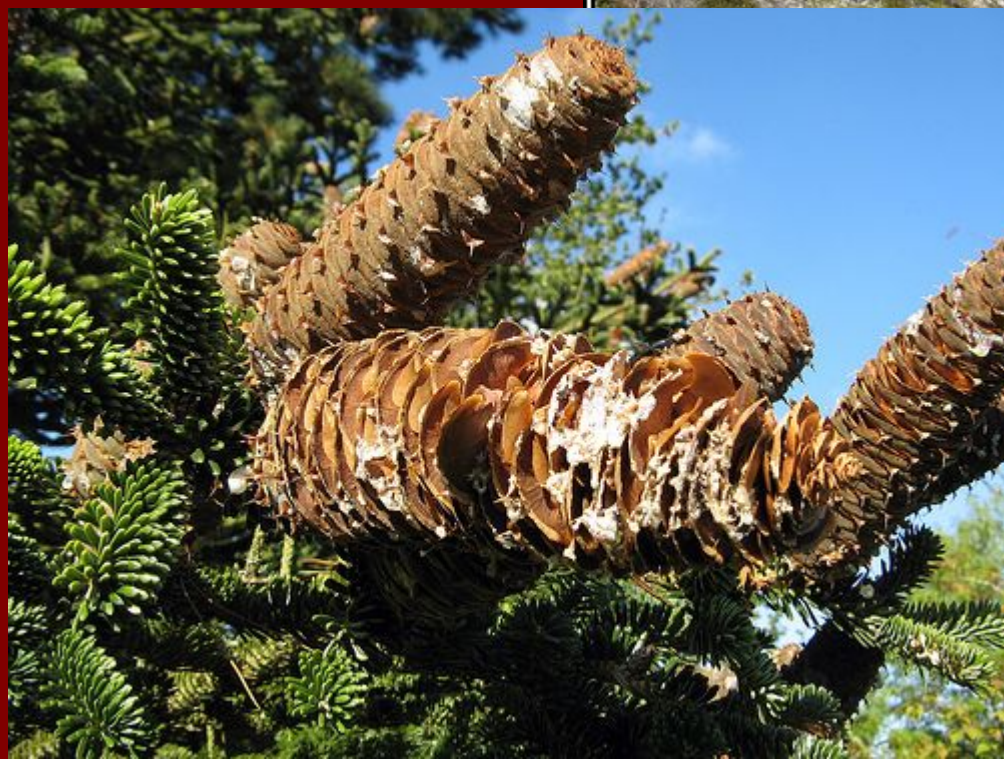
Abies NEBRODENSIS (Sicilia, M.ti Nebrodi)