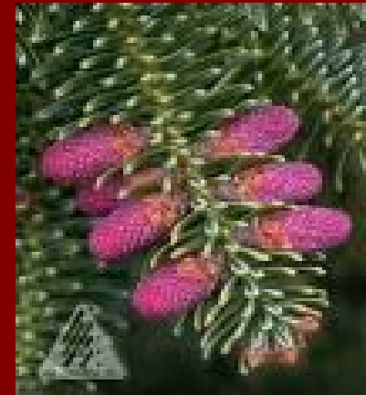
Abies NUMIDICA abete dell'Algeria